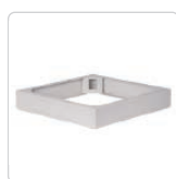
cokoły s. 158