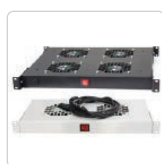
panele went. s. 151