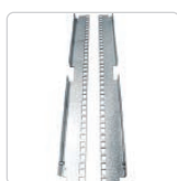
profile montażowe 19" s. 145